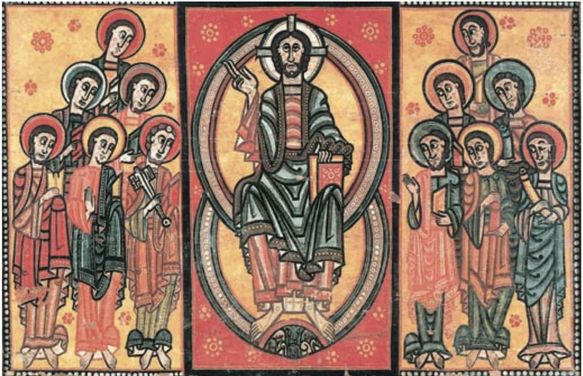
Frontal de la Seu d'Urgell o dels Apòstols, conservat al Museu Nacional d'Art de Catalunya