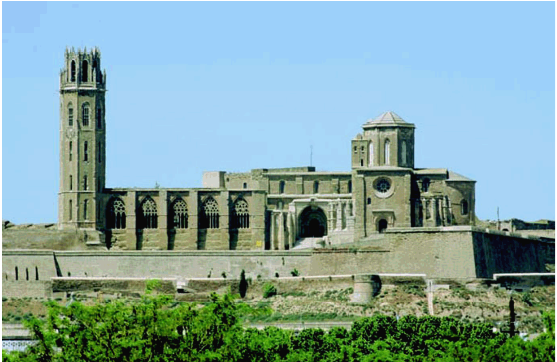
Seu Vella de Lleida, construïda sobre l'antiga suda